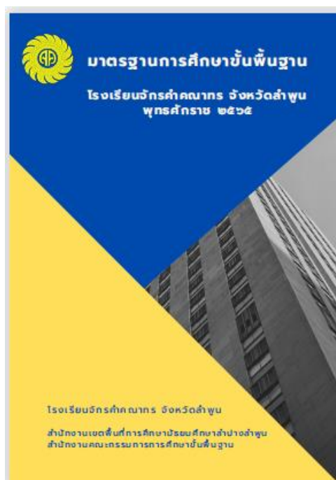
ภาพที่ 1 มาตรฐานการศึกษาขั้นพื้นฐานโรงเรียนจักรคำคณาทร จังหวัดลำพูน

โรงเรียนจักรคำคณาทร จังหวัดลำพูน ได้พัฒนามาตรฐานการศึกษาขั้นพื้นฐานของโรงเรียน ให้มีความสอดคล้องกับมาตรฐานการศึกษาชาติ ข้อกำหนดในกฎกระทรวงการประกันคุณภาพ การศึกษา พ.ศ. 2561 และแนวทางการดำเนินงานโรงเรียนมาตรฐานสากล (World-Class Standard School) ปรับปรุง พ.ศ. 2561 ประกอบด้วย 3 มาตรฐาน 29 ประเด็นพิจารณา โดยเพิ่มเติมประเด็น พิจารณานอกเหนือจากที่กำหนดไว้ในมาตรฐานการศึกษาขั้นพื้นฐาน จำนวน 8 ประเด็นพิจารณา ดังนี้ มาตรฐานที่ 1 คุณภาพของผู้เรียน เพิ่มเติม 5 ประเด็นพิจารณา ได้แก่ คุณภาพของผู้เรียน โรงเรียนมาตรฐานสากล 1) เป็นเลิศทางวิชาการ 2) สื่อสารสองภาษา 3) ล้ำหน้าทางความคิด 4) ผลงานอย่างสร้างสรรค์ 5) ร่วมกันรับผิดชอบต่อสังคมโลก มาตรฐานที่ 2 กระบวนการบริหาร และการจัดการ เพิ่มเติม 2 ประเด็นพิจารณา ได้แก่ 1) การบริหารและการจัดการโรงเรียนตามกรอบ โรงเรียนมาตรฐานสากล 2) การดำเนินงานร่วมกับเครือข่ายร่วมพัฒนา มาตรฐานที่ 3 กระบวนการ จัดการเรียนการสอนที่เน้นผู้เรียนเป็นสำคัญ เพิ่มเติม 1 ประเด็นพิจารณา คือ คุรุมีความเป็นสากล นอกจากนี้โรงเรียนได้กำหนดค่าเป้าหมายความสำเร็จของแต่ละมาตรฐานและแต่ละประเด็น การพิจารณาในระดับยอดเยี่ยม และได้จัดทำเอกสารมาตรฐานการศึกษาขั้นพื้นฐานตามภาพที่ 1 เพื่อให้ผู้เกี่ยวข้องทุกคนได้ศึกษาและนำไปพัฒนานักเรียนต่อไป