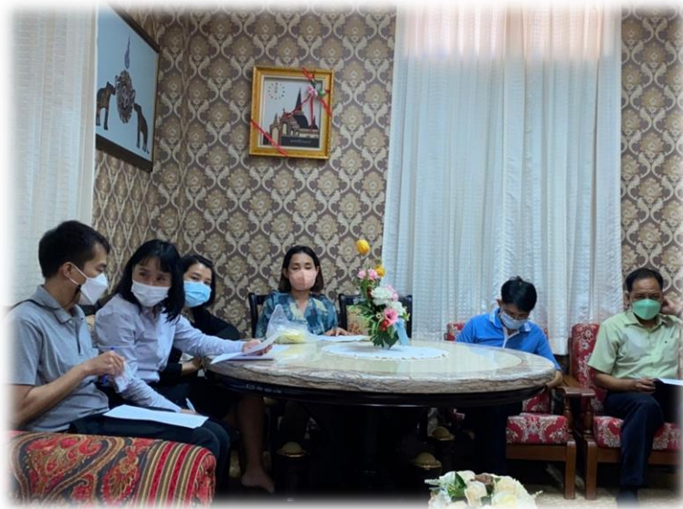
การประชุมเตรียมความพร้อมวิทยฐานะ